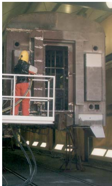
Sandstrahlen · sand blasting пескоструйная обработка

Reden Sie mit uns! Maßgeschneiderte Problemlösungen sind unsere Stärke!